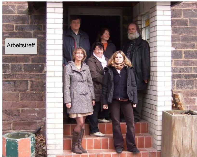
Das Team des Arbeitstreffs ist gerne für Sie da!

1,50 €/Anwesenheitsstunde für Teilnehmende über 25 Jahren